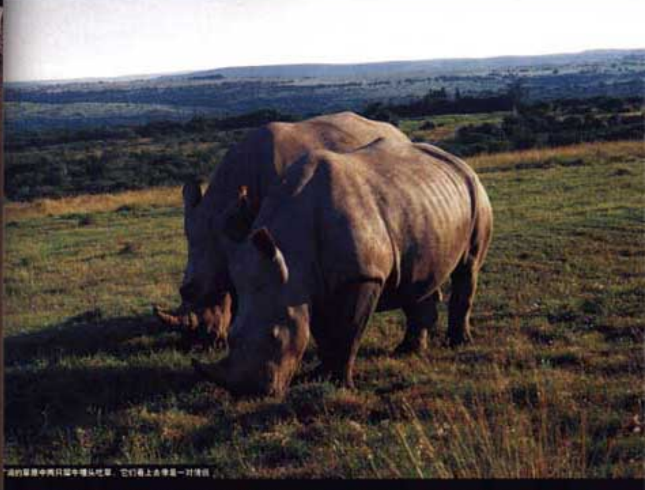
广阔的草原中两只犀牛埋头吃草，它们看上去像是一对情侣

对南非的热切向往其实是源于两年前看到的关于南非野生动物的照片——人们坐在开放式的越野车中，各种动物近在咫尺，旁若无人地嬉戏玩耍、饮水、小憩——那种人与自然、动物之间的和谐亲近深深地震撼了我……不过直到2005年5月，我才有机会如愿以偿。踏上南非这片土地，身临其境，体验与动物的近距离接触。