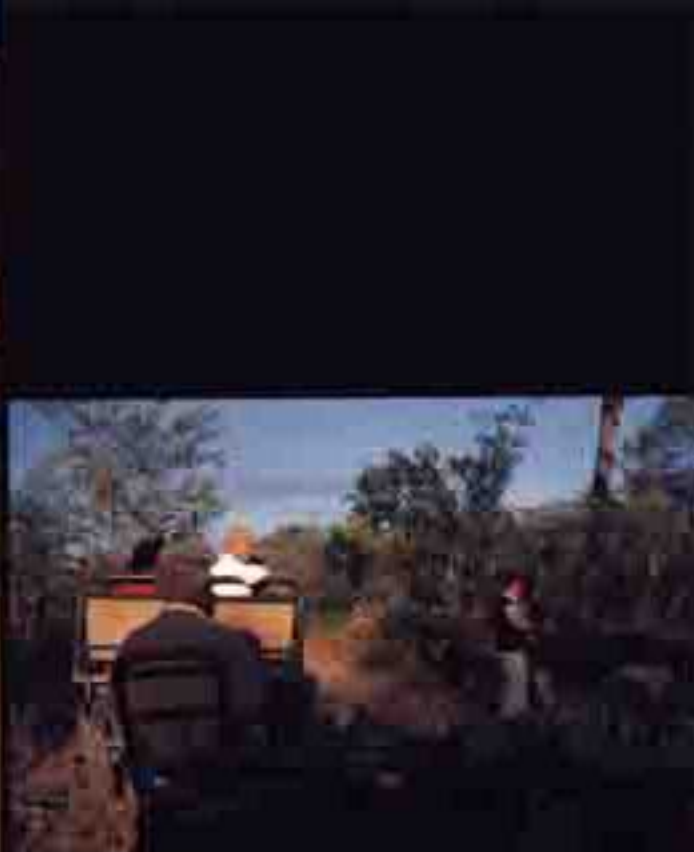
人们喜欢在清晨时坐在餐桌旁，品尝早餐

南非共有 31 635 种，本书已经出版保护区森林指南，1994 年，南非政府成立了南非第一个自然保护区，南非自然保护区分为国家公园、野生动物保护区、