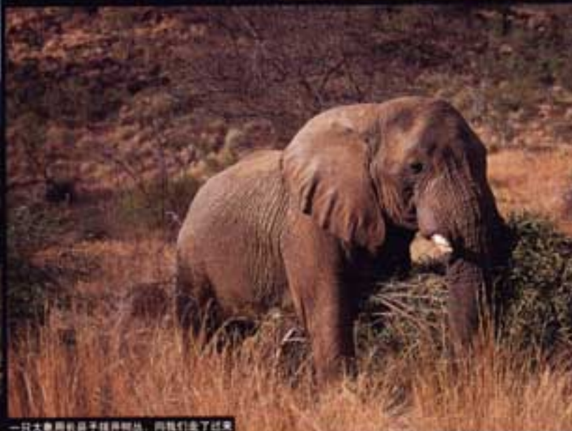
一只大象用鼻子揉弄树枝，向我们走了过来。

我们驱车紧跟着这头巨大的猫科动物，它这时已把步子放慢到步行速度，只见河谷中央躺着两只死羚羊，旁边还有三只浅褐色的母狮，正等待雄狮到来再开始美餐，这是我头一次看到非洲最凶猛的食肉动物捕食的情景，那只雄狮把羚羊赶入了死亡陷阱，当其中一只母狮发出“咳嗽”声时，那只是一个信号，表示羚羊已进入阵地，计划和捕杀的工作配合得天衣无缝，无懈可击。