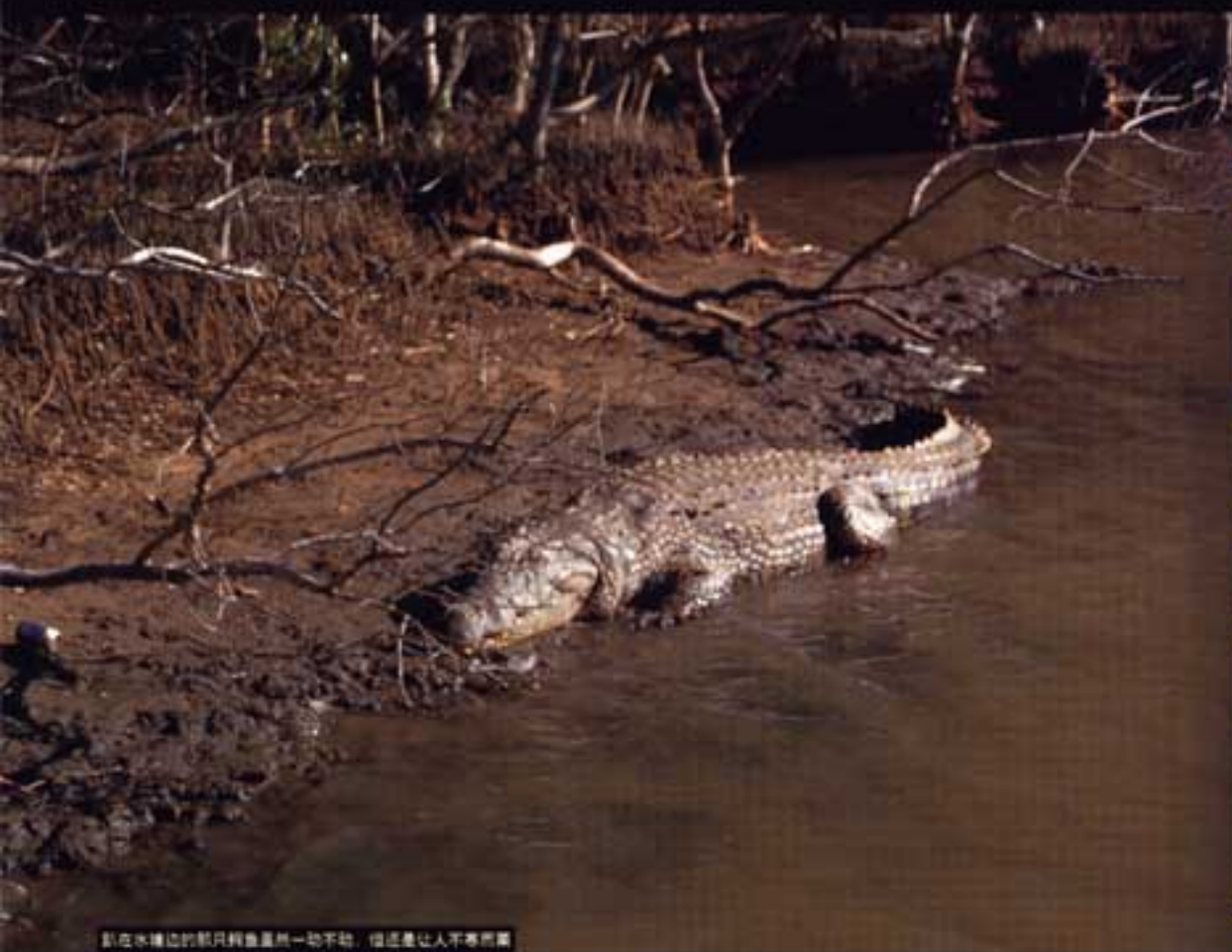
躺在水边的鳄鱼好像全然一动不动，但是让人不寒而栗