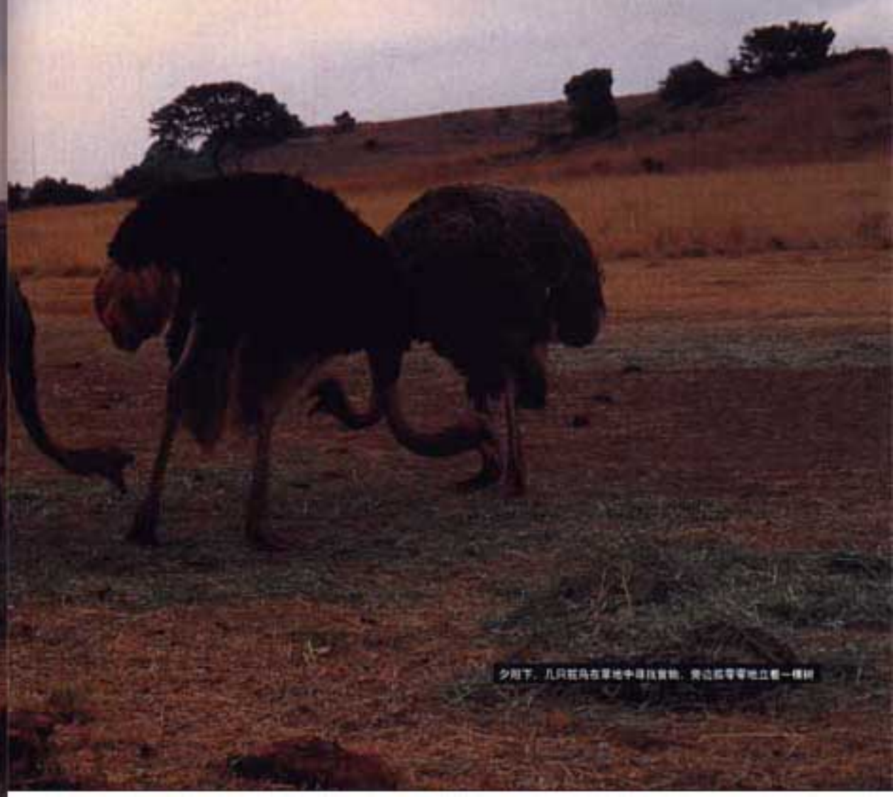
夕阳下，几只鸵鸟在草地中寻找食物，旁边孤零零地立着一棵树

那片保存完好一望无际的非洲原始丛林是动物赖以生存的天堂，在那里，斑马、羚羊、鹿、犀牛、狮子、野牛们自由地奔跑，无情地捕猎食物，与天敌作殊死搏斗……野性肆意，疯狂尽现。而当夜幕降临，广袤的草原却宁静而温柔。