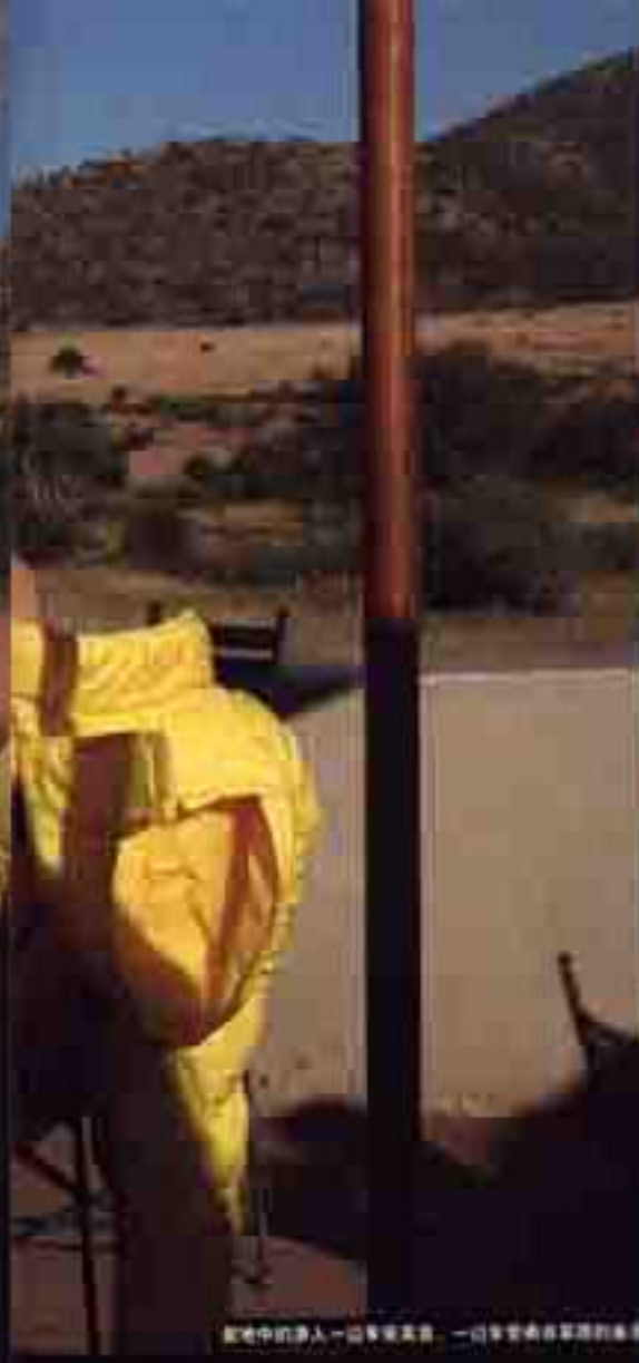
家中的伊人——威廉夫人，一位非常棒的导游

晚上临睡前，我坐在主屋的长藤下，来一杯在庄园人自酿的葡萄酒。在静谧的夜色下，我仿佛感受到了大自然的脉搏——平静而安详。午夜十分，我在